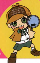
イラスト: サナダン

名探偵! 山田コタロウ「宇宙船からの脱出編」 脚本・演出: 田坂哲郎 宇宙探偵になって、ナゾの宇宙船から脱出しよう! お申し込み: クラギ文化ホール窓口にて (限定40名)