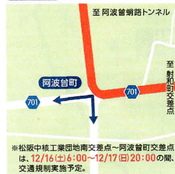
⑪ 阿波曾町 10:00~15:00*