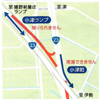
③ 小津町/小津ランプ 8:30~11:50