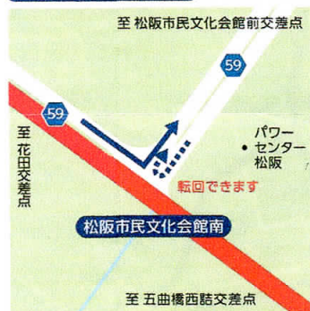
⑦ 松阪市民文化会館南 9:00~11:50