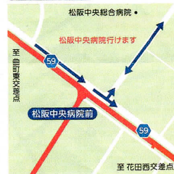
⑧ 松阪中央病院前 9:15~11:50