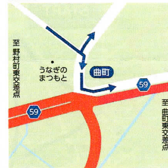
⑨ 曲町 9:15~12:30