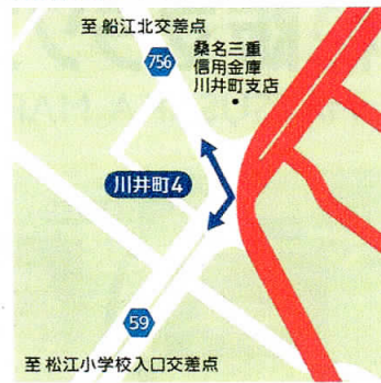
④ 川井町4 8:30~11:15