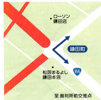
② 鎌田町 8:30~10:45