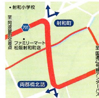
⑫ 射和町/両郡橋北詰 10:00~16:10