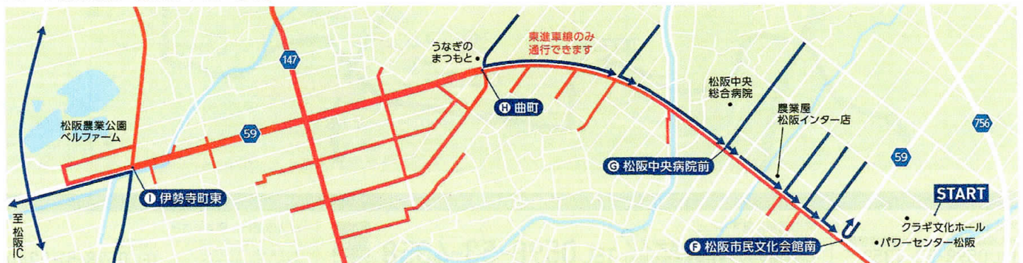
スタート会場付近~松阪IC 9:15~12:30