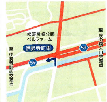
⑩ 伊勢寺町東 9:15~12:30