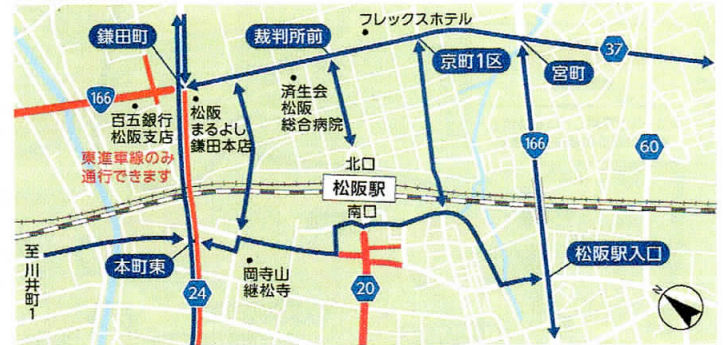
⑥ 松阪駅前 9:00~11:15